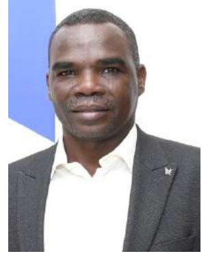
إعداد : أحمد أبو الجاز